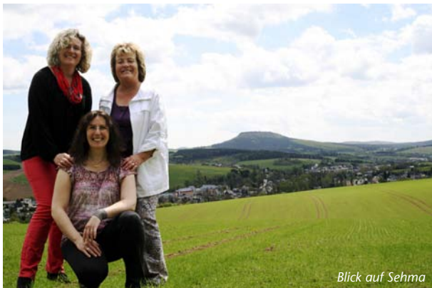
Blick auf Sehma